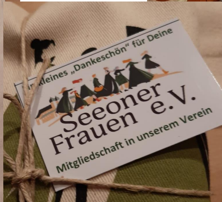
Unser Willkommensgeschenk für die Mitglieder