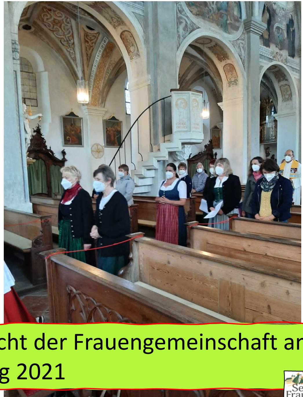
Maiandacht der Frauengemeinschaft am Muttertag 2021