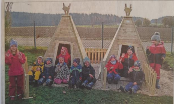
Sichtlich Spaß haben die Kindergartenkinder in Seeon mit ihren beiden Tipis und den Spielzäunen im Garten.

Spende durch „Alten Wirt“ und Seeoner Frauen